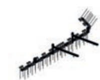
Rastra de puas