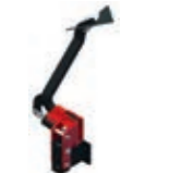
Brazo abatible adicional